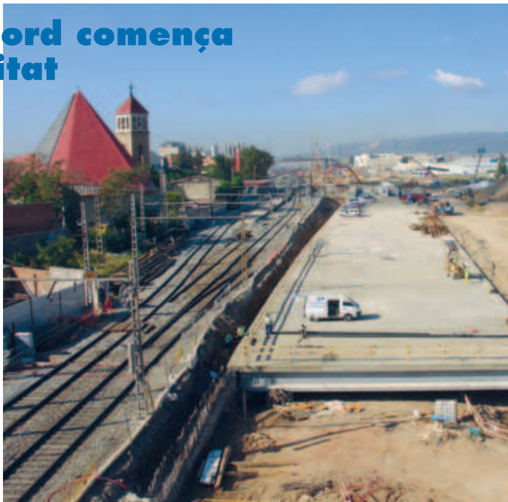
Obres de cobertura de les vies al sector de La Seda. A la dreta es veu la plataforma sota la qual circularan els trens de rodalies.

Les raons per començar a executar l'Eixample Nord per aquests sectors de La