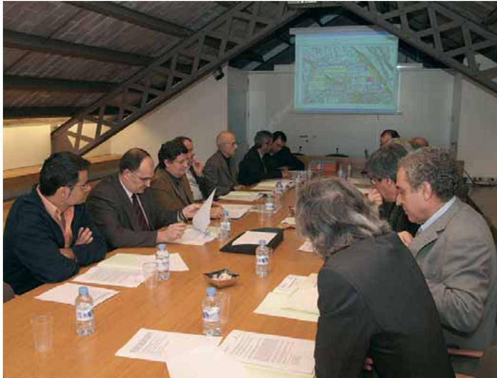
Moment de la constitució del consorci, a la Casa de la Vila del Prat

En aquest àmbit convergeixen les grans infraestructures de la zona: les carreteres