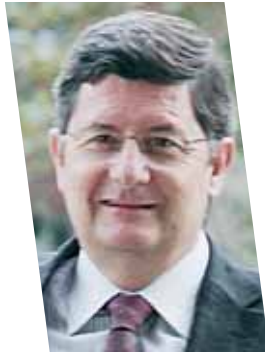
Lluís Tejedor L'alcalde

Y a hace seis años, aproximadamente, que en el Ayuntamiento estamos trabajando en el proyecto de ciudad que llamamos Ensanche Norte. Remarco esta fecha porque nuestro modelo de desarrollo es el caso contrario del que tienen en algunos lugares, cuando deciden construir nuevos barrios, donde la improvisación y el aprovechamiento de unos cuantos promotores privados se impone a la reflexión y la coherencia urbanística, que tiene que ser la base para la defensa del interés de la ciudadanía y de su bienestar.