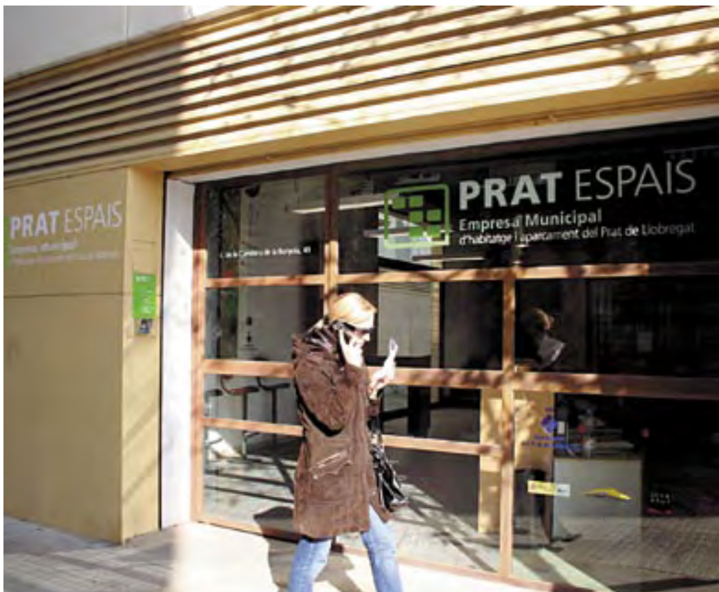
Oficina de Prat Espais, en el número 49 de la Carretera de la Bunyola.

A fin de favorecer el correcto mantenimiento del parque de vivienda de la ciudad, Prat Espais ha gestionado 53 expedientes de rehabilitación, 62 Tests de edificios y 11 Informes internos de ido-