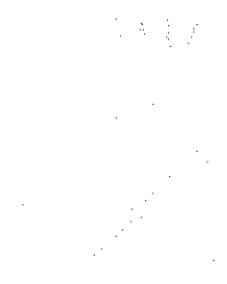
Figure 1: A line graph showing a linear relationship between two variables. The x-axis is labeled 'x' and the y-axis is labeled 'y'. A straight line passes through the origin (0,0) and has a positive slope. The line is labeled 'y = 2x'.